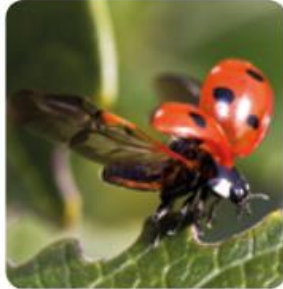
VAQUITA DE SAN ANTONIO